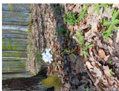
kyčelnice cibulkonosná ( Dentaria bulbifera )