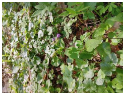
plicník tmavý ( Pulmonaria obscura )

Více na: Křivoklátské směsi — Report vygenerován: 08. 03. 2026, autor Přemysl Lúa Černý