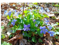
violka lesní ( Viola reichenbachiana )