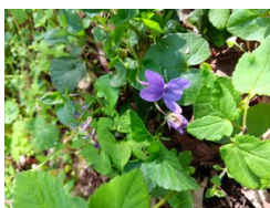
violka lesní ( Viola reichenbachiana )