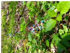
hrachor jarní ( Lathyrus vernus )