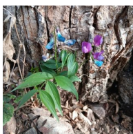
hrachor jarní ( Lathyrus vernus )