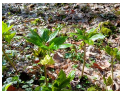
kyčelnice devítistá ( Dentaria enneaphyllos )

Náhledy z vybraných záznamů rostlin v regionu Křivoklátsko.